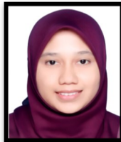
JAWATANKUASA AUDIT MASTURA