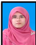
JAWATANKUASA LATIHAN NURHIDAYAH