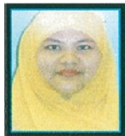
JAWATANKUASA LATIHAN RUZANA